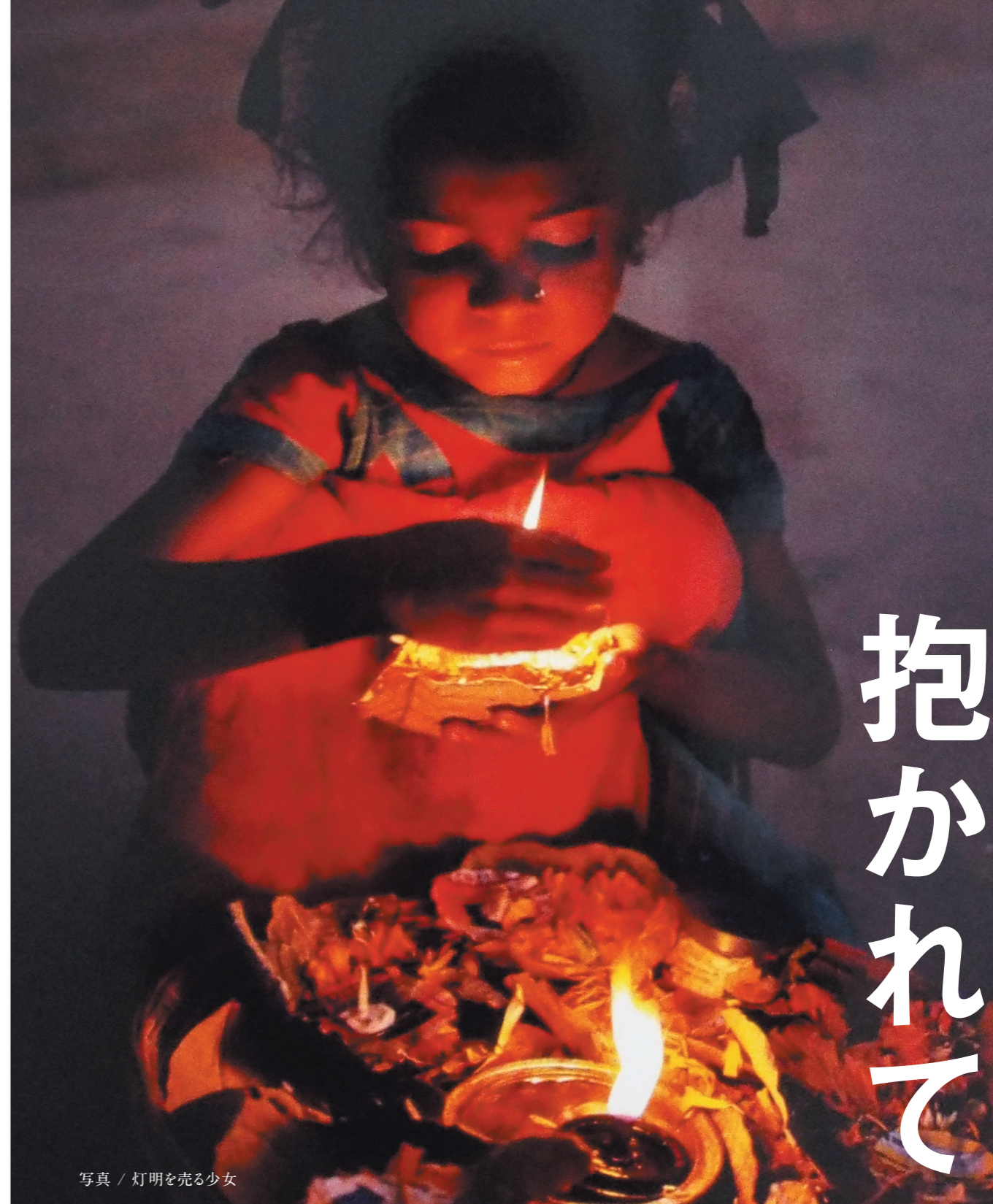
写真 / 灯明を売る少女