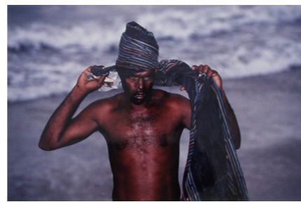
フィッシング ビレッジ(4枚組)