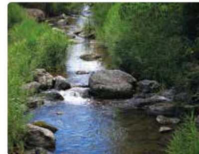
近くを流れる嵯峨川

また、防災用品の備蓄倉庫など、有事の際は「住民の避難や災害復旧の支援拠点」としての機能を持つ施設として、地域の活性化と安心・安全をめざします。