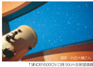
↑SINDEN500CN 口径50cm 反射望遠鏡

7/15 木星食を見よう！ 7/28 土星の輪っかを見よう！ ★詳しくはイベント情報へ