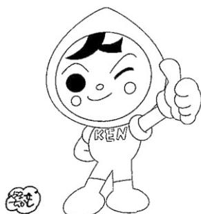
人権イメージキャラクター 人KENまもる君 人KENあゆみちゃん