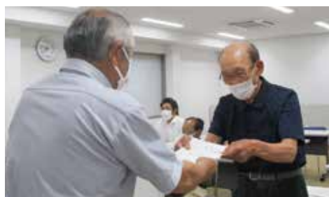
星山会長から農地利用最適化推進委員に委嘱状を交付